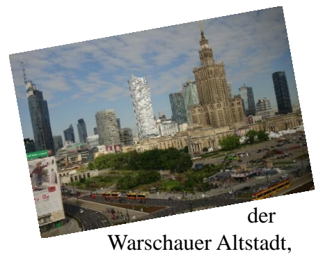
der Warschauer Altstadt,

Nach der Ankunft nach Warschau erfolgt der Transfer mit dem Bus zum Hotel. Einchecken und Zeit für das Mittagessen. Anschließend geführte Stadtbesichtigung von Warschau mit einem Reiseleiter. Wir beginnen mit dem Aufstieg zur Aussichtsplattform des Kultur- und Wissenschaftspalastes – einem „unwillkommenen Geschenk“ von Josef Stalin, das bis heute ein Wahrzeichen der Stadt ist. Danach machen wir einen Spaziergang durch die Gegend, die nach den Zerstörungen im Krieg vollständig wiederaufgebaut wurde.