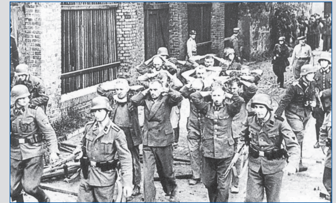
Gefangennahme der Verteidiger der Polnischen Post in Danzig (1. September 1939)