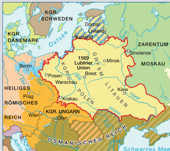
16. Jahrhundert: Kgr. Polen-Litauen