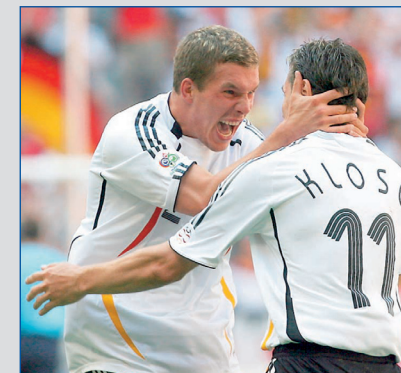
Miroslav Klose und Lukas Podolski - der deutsche WM-Sturm 2006 stammte aus Polen.